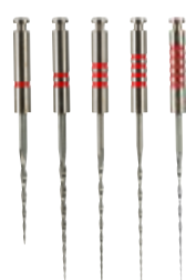
Rotazione continua S5 System